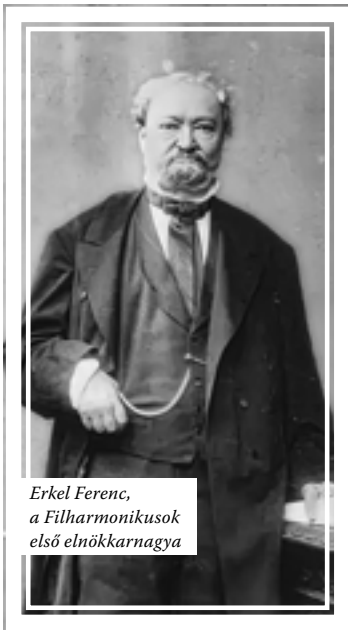
Erkel Ferenc, a Filharmonikusok első elnökmagya

Laskai Anna természetesen számos krónikás-előd munkájára épített. Egyrészt azokéra, akik az évek során összegyűjtötték és rendezték a dokumentumokat, másrészt azokéra, akik könyvekben és tanulmányokban jelentették meg a zenekar tevékenységével kapcsolatos ismereteket. A legjelentősebb összefoglalásokra és azok publikálására az évfordulók adtak alkalmat: Mészáros