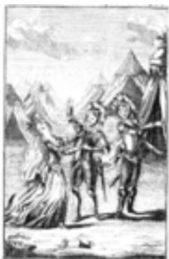
Jelenet Haydn Armida c. operájának pozsonyi előadásából

Az ismert forrásokból szerencsére napra lebontva ismerjük az első három évad programját, továbbá a negyedik, 1788-as szezon bemutatóinak teljes – vagy szinte teljes – listáját is; az 1789-es program sajnos nem maradt fenn. A repertoár nagy részét alkotó olasz operák – opera seriák és opera buffák – mellett gyakran állítottak színpadra német singspieleket, néhány esetben pedig francia operákat is, mint már említettük, mindig németül. Az olasz recitativókat német nyelvű prózai dialógusokkal helyettesítették, a singspielek gyakorlata szerint. Az előadások hétfőn és pénteken zajlottak, elkerülve az átfedést a városi színház előadásaival. 1785 májusa és 1788 vége között 45 bemutatót tartottak; ez havi egy, néha két premiernek felel meg. Ezek közül 31 darab (jó kétharmad) volt olasz opera, 10 német singspiel és négy francia opera. 1785-ben és 1786-ban négy Haydn-operát is bemutatottak, és lehetséges, hogy az utolsó évben egy ötödiket is.