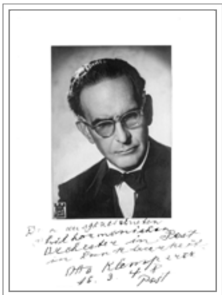
Otto Klemperer dedikált fényképe, 1948