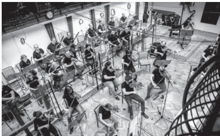
A Magyar klasszikus zene napján

hogyan szomorú számokat hoz, hiszen az év eleji lezárásokat követően nem lesz könnyű visszaütni az embereket a koncerttermekbe. Kft.-ként pedig nem lehetünk tartósan mínuszban. A korábbi években – úgy fogalmaztam –, hogy pozitív nullán álltunk. Persze azzal a zenei körökben is mindenki tisztában van, hogy a ‘nem működés’ a legolcsóbb, így a vészhelyzeti korlátozások nem okoztak akkora gondot. Természetesen tartottunk streamelt koncerteket a Filharmonia sorozatának részeként. Sajnos nálunk az is problémát jelent, hogy bár a Művészetek Háza szolgál számunkra hangversenyteremként, 2013 óta – mióta a Kulturális Központ az üzemeltető – nem tudjuk korlátlanul elérni ezt a helyszínt, s a technikai felszereltsége sem elegendő arra, hogy onnan streamelt koncerteket közvetítsünk. Arra pedig, hogy béreljünk egy stábot, már végképp nem jutott forrásunk. Annak is örültünk, hogy pályázati pénzből legalább néhány felvételt elkészíthettünk.