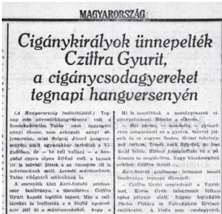
A Magyarország írása az 1936. márc. 26-i hangversenyéről

rai, túlkorai modorosságokat. Pedig aki úgy tud dalolni zongoráján, mint ő, joggal tartozik az intézet reménykeltő növendékeinek első sorába! Kár lenne érte, ha könnyebbik végénél fogná meg a dolgot.”