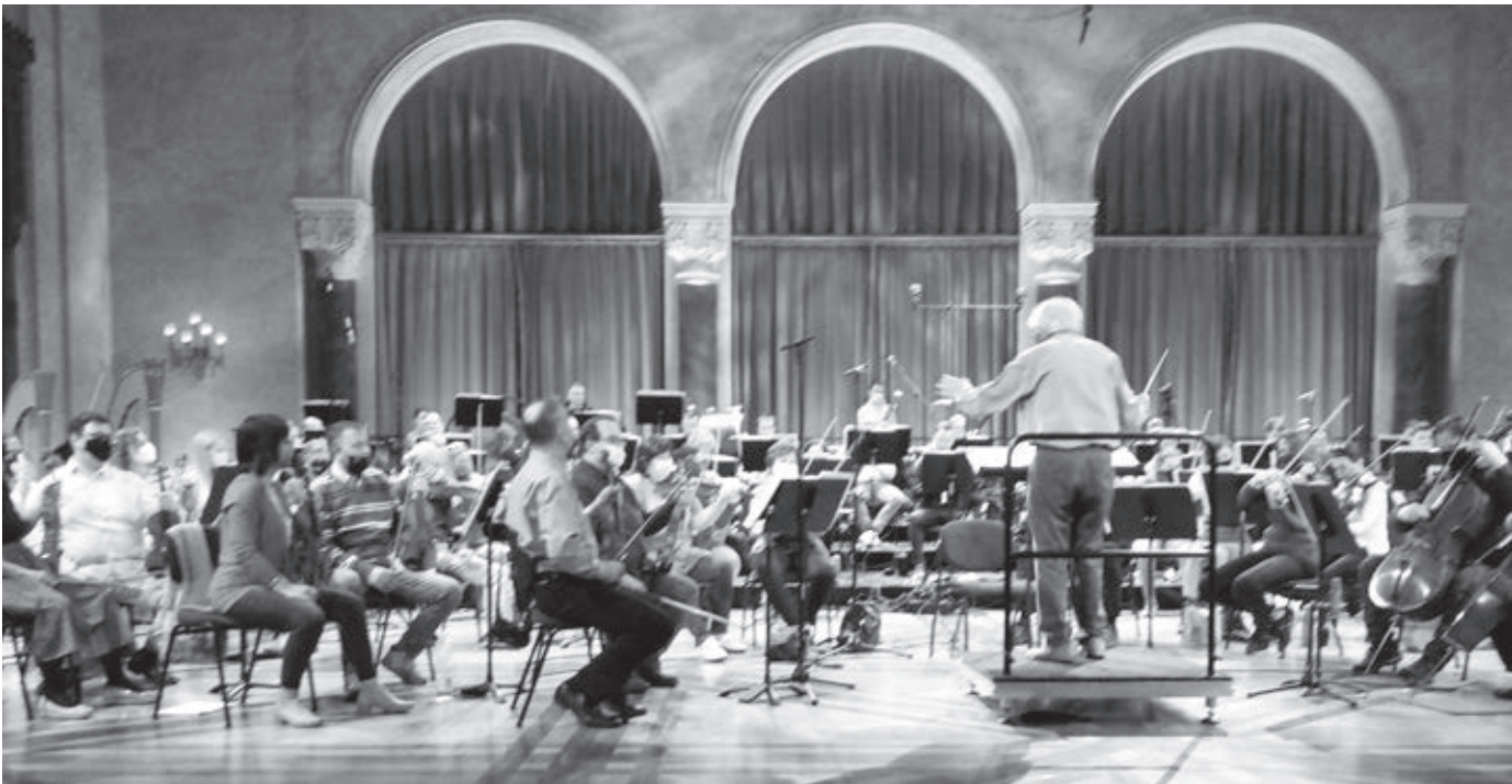
Próba a Pesti Vigadóban

– Nem értem, miért, hiszen tudniuk kellett volna, nem volt titok. Érezzük is az ellenszenvet, telefonhívásokon, leveleken, igazgatói utasításokon keresztül,