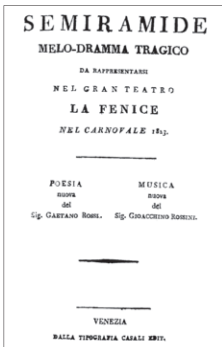
A bemutató címlapja

Rossini Semiramide című két-felvonásos drámai operája a pesarói mester utolsó alkotása az opera seria műfajában. A velencei La Fenice színház számára komponálta, akárcsak 10 évvel korábbi műfajtestvérét, a Tancredi , amellyel első átütő sikerét aratta. A két velencei premier között eltelt évtizedből azonban a zeneszerző hét esztendő t Nápolyban töltött, aminek hatása természetesen nem múlt el nyomtalanul. Ennek ellenére számos közös vonása van a két olasz seriának, amelyek annak az évtizednek a két végpontját jelzik, ami során Rossini jelentősen átalakította az olasz opera tájképét. Mindkét mű szöveggönyve Voltaire azonos című színművein alapul, és librettistájuk is közös: Gaetano