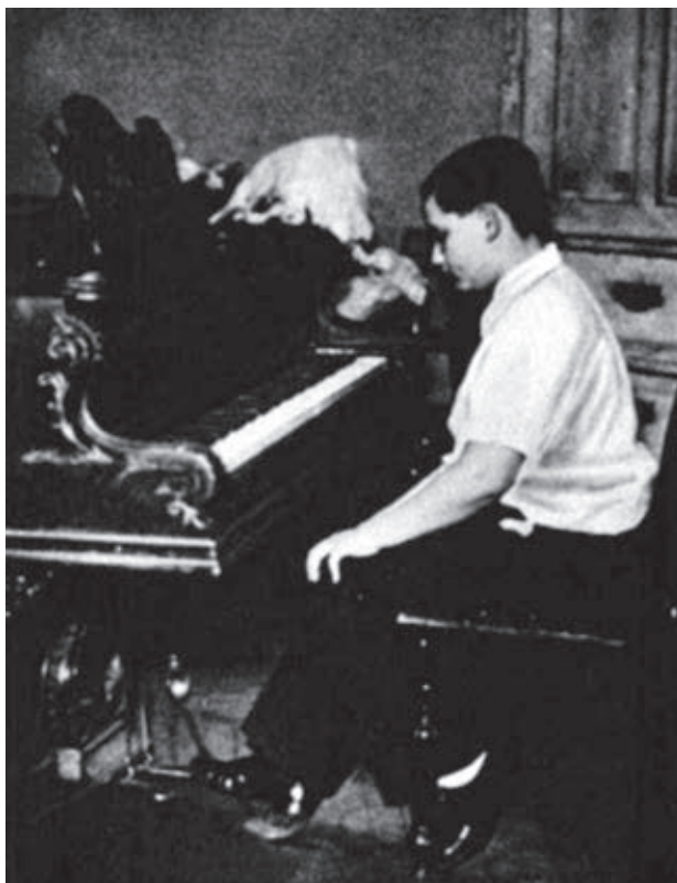
Otthonában, gyakorlás közben (1934)

Az Ujság kritikusa úgy vélte, hogy játéka sokat fejlődött utolsó szereplése óta: „Technikája már is olyan csillogó, annyira biztos lett, hogy a legnehezebb passageok is szinte maguktól értetődően hatottak játékában. [...] Csodálatos pianista készsége remekül juttatta érvényre a ritkán hallható alkotás minden szépségét, minden finomságát és minden briliáns hatását. A közönség szinte megbabonázottan hallgatta a csoda-