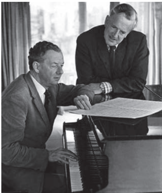
Benjamin Britten és Peter Pears

tülfizetettnek tartották. A 18. század első évtizedeiben ezért született meg a jellegzetes angol operaszatíra, melynek egyik tipikus darabja Lampe 1745-ben írt alkotása. A mű az angol nyelvű masque és az opera-paródia keveréke, melyben a szerző nem Shakespeare darabját vagy szereplőit teszi neveltség tárgyává, sokkal inkább az olasz operát és az olasz énekeseket figurázza ki. A „színdarab a színdarabban” történetét egyébként maga Shakespeare is parodizálta. Már a cím is neveltségessé tette azzal, hogy a „tragédia” szó helyébe „komédia”-t írt, ily módon: Egy igen siralmas komédia, Pyramus és Thisbe borzasztó kegyetlen haláláról .