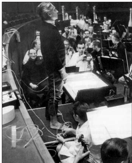
Herbert von Karajan mint teszt-személy. A nyugodtabb, de őt belsőleg megindító zene dirigálása pulzus-frekvenciáját jobban megnövelte, mint merész repülési manőverek közben.

kenysége korábbi vizsgálódásokra emlékezett. Ezekben zenészek és nem-zenészek keringési reakcióit vizsgálták zenehallgatás közben és megállapították, hogy a zenészek pulzusszáma ilyenkor megnőtt, de a kontroll csoporté nem.