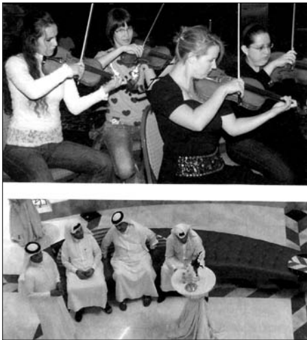
A Katari Filharmonikus Zenekar tagjai próba közben, az alsó képen oldott atmoszféra a koncertszínenben