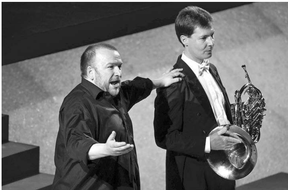
Wagner-napok 2008. (archív)

Nem erről van szó. Ez a 125 éves ház a XIX. század közepének akusztikai elképzelései és igényei szerint épült. Ezzel nem azt mondom, hogy akkor itt már ne is játszottunk Wagnert vagy még későbbi műveket. Én személy szerint ugyan a XIX. század első felét jobban el tudom képzelni az Operaházban, mint a második felét vagy a XX. századi műveket, de ez sem azt jelenti, hogy nem fogok Bartókot vezényelni az Andrassy úton.