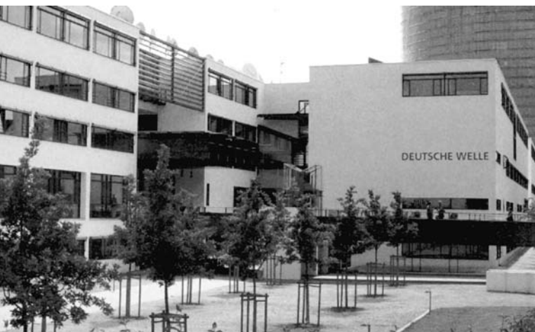
A Deutsche Welle központja Bonnban, a Kurt-Schumacher utcában

és énekkarok Kft” együtteseinek, (a Deutsche Symphonie-Orchester (DSO), a Rundfunk-Sinfonieorchester Berlin, a nagy Rádiókórus és a RIAS Kamarazenekar) kiválasztott külföldi vendégszerepléseit és projektjeit kísérjük figyelemmel. Számunkra emellett fontos, hogy jelen legyünk azokon a helyszíneken, ahová más német vagy külföldi zenekarok általában nem jutnak el, például mivel gazdaságilag nem kifizetődő. A koncert-helyszín kiválasztása – Abu Dhabi, Bukarest vagy éppen az évben Belgrád és Nagyszében is – kultúrpolitikai keretbe tartozik. Fontos számunkra a DW stratégiai érdeklődése a mindenkorai célterületen. Ez már olyan mint valami misszió. A német és európai zenei kultúra követeinek érezzük magunkat. Ha azt tapasztaljuk, hogy az emberek