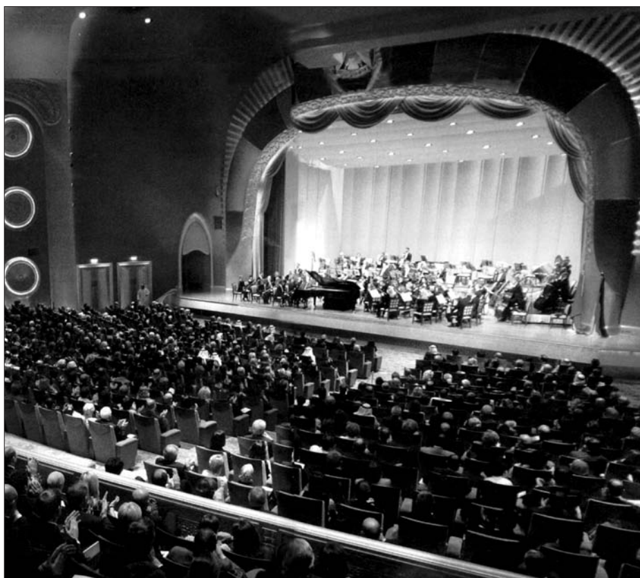
A Deutsche Symphonie-Orchester Berlin

– A Deutsche Welle a szövetségi költségvetés közvetlen finanszírozását élvezi. Munkánk ezzel egészen konkrét keretfeltételek és határok közé van szorítva. Mi elsősorban a berlini „Rádiózenekarok