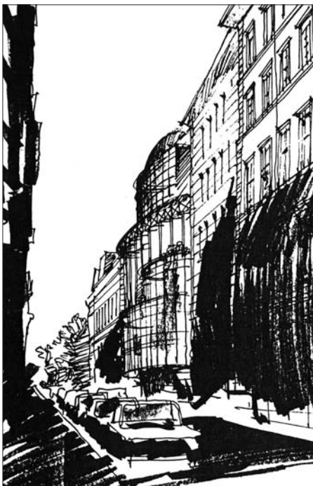
A tervezett koncertterem Múzeum utcai homlokzata

A 90-es években a kérdést hangmérnöki oldalról ismét felmelegítettük ugyan, ám próbálkozásunkat most meg a tervezett Világkiállítás ürügyén az illetékes