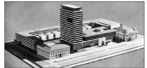
Az ÁÉTV tervnek a Rádió jelenlegi telephelyére szánt makettje. (Nánási Sándor, 1966.)

A Rádió műsorstruktúrája időközben módosult (megjelentek a kereskedelmiek