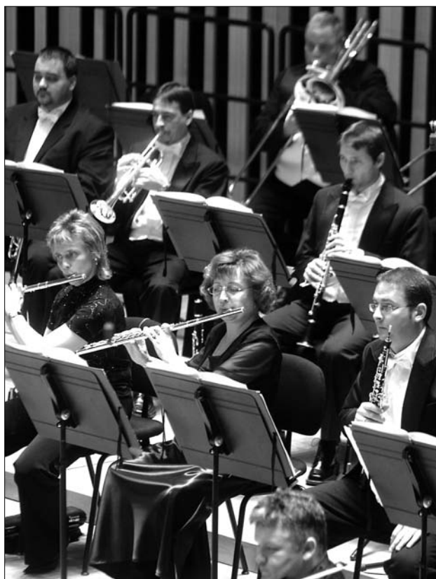
A Győri Filharmonikus Zenekar