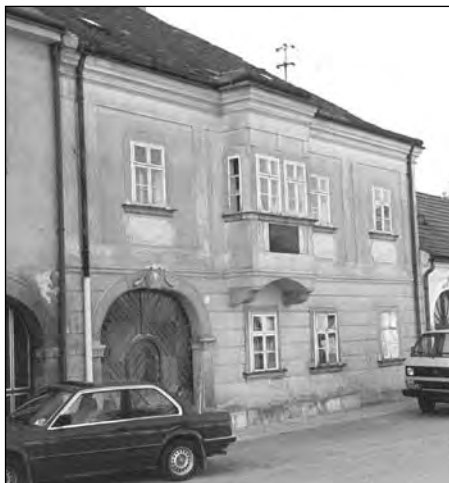
Joachim József szülőháza Köpcsényben (Kittsee, Ausztria)

Halálának 100. évfordulójához közeledve különösen indokolt, hogy további számvetést végezzünk örökségét illetően, amit a világ hegedűművészetére hagyott. A halálának ötvenedik évfordulóját követő évben (1958. február, Muzsika) Reményi-Gyenes István emlékezett meg róla „Egy elfelejtett évforduló margójára” című írásával, majd 1981-ben (Magyarország hetilap, 32. és 33. szám) Joachim születésének 150. évfordulóján, két részben megjelent tanulmányában hívta fel a figyelmet korszakalkotó jelentőségű hegedűsünkre, emléktábla elhelyezését javasolva Joachim 1839. március 17-i, első pesti fellépésének emlékére, az egykori Nemzeti Kaszinó helyén (Dorotya u. 5.) lévő épület falán. A tiszteletre méltó kezdeményezés megvalósult, és „a minden idők egyik legnagyobb hegedűművészenek és pedagógusának” emléket állító tábla ma is ott látható a Pénzügyminisztérium épületén.