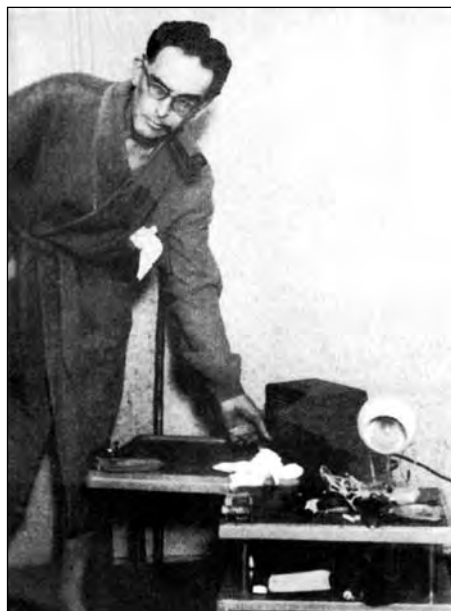
A Csengery utcai lakásban....

Bosszút állt ő rajtam, már 1950 februárjában. Erich Kleiber járt itt az IX-ik olvasatával. Azt éreztem, ő összeszereli a művet, miközben elővárásolja minden eldugott szólamát, míg Klemperer egy roppant öntvényt hozott létre. „Aus einem Guß” – mondja a német; lefordíthatatlan, egyöntetű szavunkban él valami hasonló kép, de merőben más jelentéssel. A nyitó-