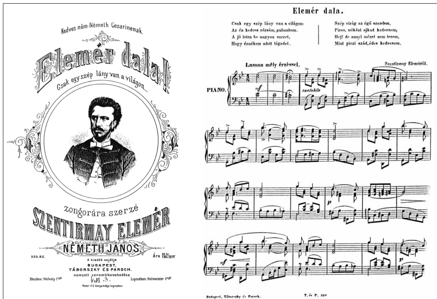
Szentirmay Elemér 1873-ban készült „Csak egy szép lány” kezdetű dalának részlete (1874, Budapest, Tábornszky és Parsch nyomdája)

Kerényi György „Szentirmay Elemér” című (1965, 16. l.) munkájában említi, hogy „A dalnak ez a zongoraátíratra került