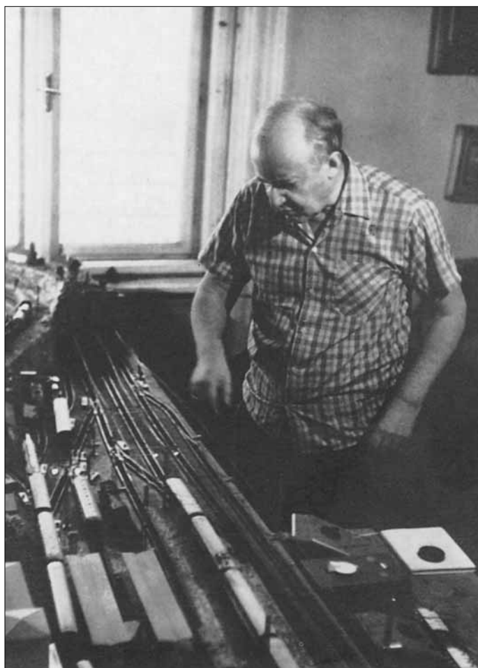
Pihenő, játék a kisvasúttal