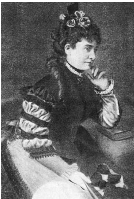
Szentirmay felesége, akinek a „Csak egy szép lány” című dalt ajánlotta. Üveglapra festett kép, Párizsban készült 1878-ban.

bele kicsinyített hasonmásban abba a zsebkönyvecskébe, amelyet a magyar kiadó az 1878-as párizsi kiállításra jelentett meg költők műveiből... Nyilván ennek a révén ismerte meg Jules Claretie francia regényíró...” (Claretie magyar tárgyú, „Le prince Zilah”, 1884-ben megjelent regényének egyik fejezetében ír a „Csak egy szép lány” c. dalról, fűzi hozzá Kerényi.) Az előbbi információhoz kapcsolódva említjük, hogy a Vasárnapi Újság 1878. július 2-i számának „Mi újság?” című rovata a világiállításról tudósítva ad hírt a párizsi magyar csárdával és az ott hallott zenével kapcsolatban Jules Claretie-nek, az „Independance Belge” című lapban közölt, elragadtatott hangvétellű beszámolójáról.