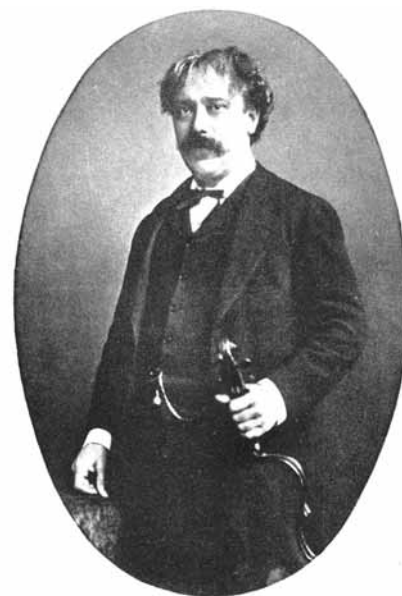
Pablo de Sarasate

A művet előadó művész számára tér nyílik, hogy próbának vesse alá magát, meddig terjednek képességei, ugyanakkor a cél mégiscsak az, hogy a zeneművet ne tegyék tönkre. Az előadó segítségére lehetnek a híres, tehetséges lengyel hegedűművész, Eugenia Umińska gondolatai: »Nagyon nehéz pontos és részletes útbaigatást adni ennek az igen dinamikus műnek az eljátszásához. A művésznek képességeihez mérten leginkább a cigány előadói stílust kell utánoznia. Ezt a legjobban úgy érheti el, ha meleg, erőteljes hangon, temperamentumosan játszik. Ezt az erőteljes, improvizatív játéktípust mindenképpen a megadott ritmus és a természetes zenei lüktetés határain belül kell alkalmazni. Ezen határok tiszteletben