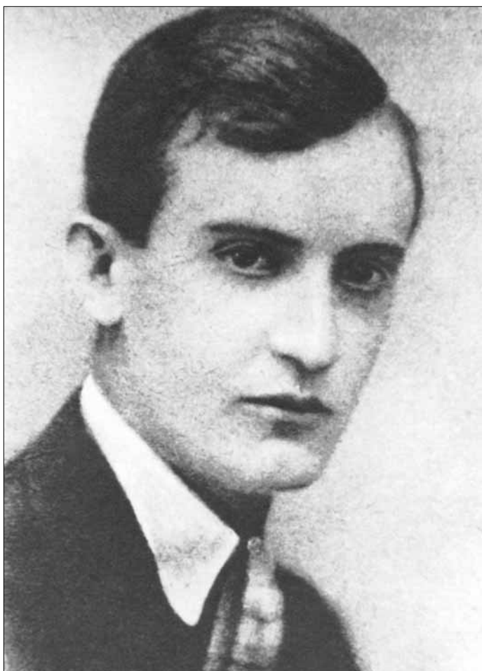
A fiatal, Ferenc Józsed-díjas zeneszerző