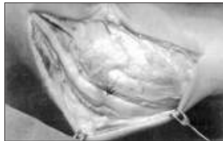
Könyöki idegnyomódás (nyíllal jelezve) bemutatása operáció közben.