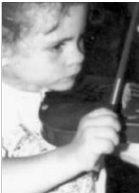
További példák az orvosilag aggályos tartásra és játéktechnikára.