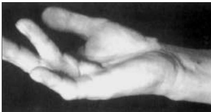
A „Dupuytren” jelenség korai stádiuma: enyhe hajlító behúzódnás főleg a 4. ujj alapizületében és csomók a tenyérben.