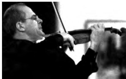
máig is elnöke a versenyt rendező alapítványnak. 1990 óta az esseni Folkwang Főiskola hegedű professzora.

Sajnos én a helyzetet elég pesszimistán látom. Az iskolának nagy szerepe van abban, hogy a gyerekek és fiatalok megszeressék a zenét. Úgy látom, hogy ez alacsony fokon vesztett jelentőségéből. Ez igen sajnálatos. A zenére specializált általán-