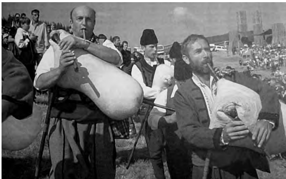
Bolgár zenészek tradicionális rubában egy folklór fesztiválon a Rozben hegységben Dél-Bulgáriában

Általában jól. Igen pozitívan hat az, hogy a bolgár muzsikusra bizonyos területeken az EU-normák és jogszabályok vonatkoznak. Ezek ugyan sokszor egészen kis ügyek, de mégis világossá teszik, hogy mi a zenekari területen jó úton haladunk. Számként Németország a példa, ami a munkafeltételeket, a professzionális zenekarokat illeti, és azon munkálkodunk, hogy minél többet megtudjunk. Ehhez azonban még intenzív szakmai cserelehetőség is szükséges, különösen menedzser- és know-how viszonylatban.