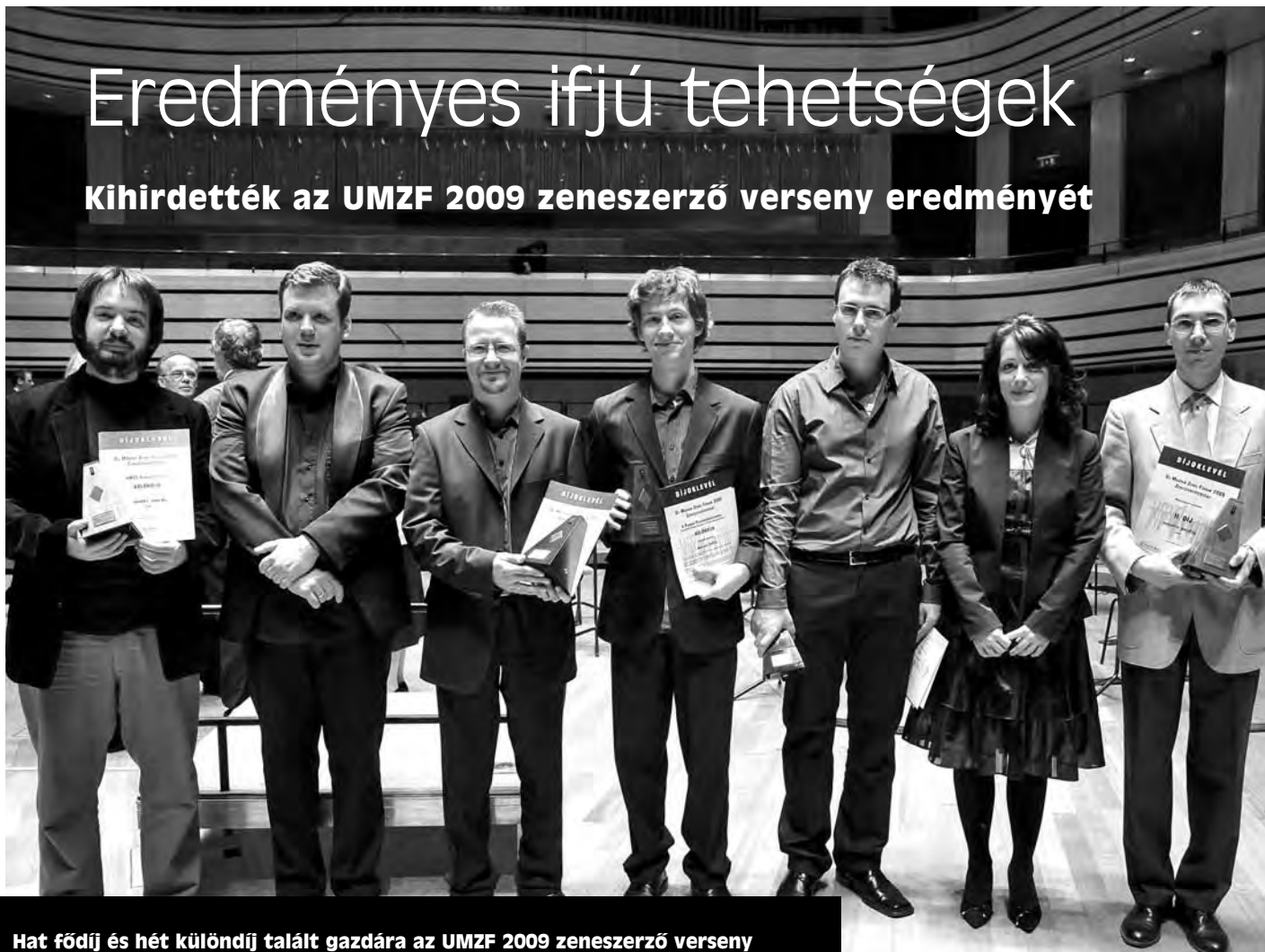
Hat fődíj és hét különdíj talált gazdára az UMZF 2009 zeneszerző verseny január 12-i, Művészetek Palotájában rendezett döntő-gálakoncertjén.

Kihirdették az UMZF 2009 zeneszerző verseny eredményét