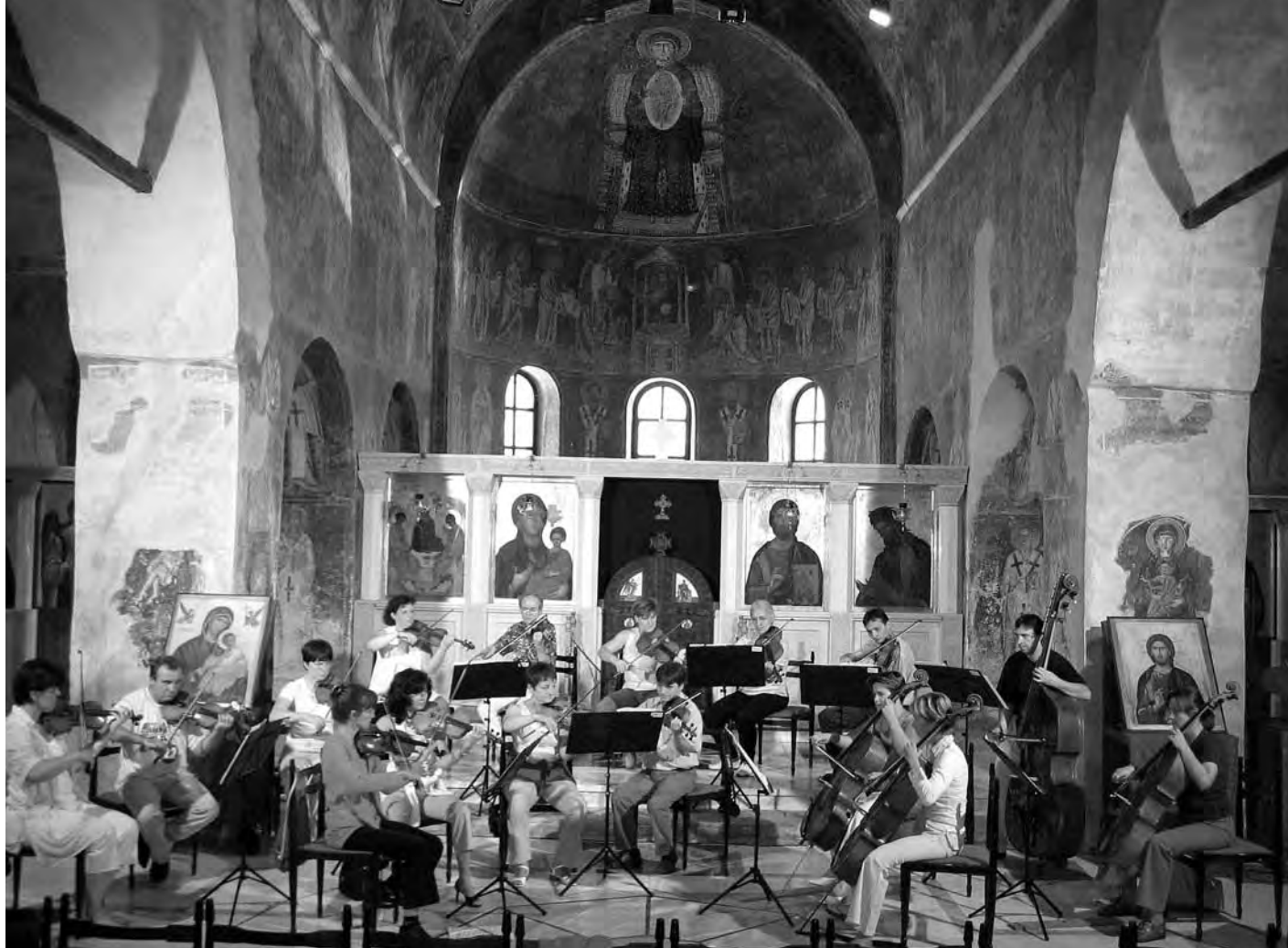
A MÁV Szimfonikus Zenekarból alakult kamaraegyüttes