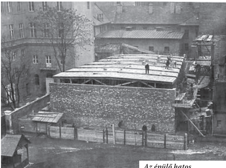
Az épülő hatos

75 évvel ezelőtt, egy nemzetközi tanulmányút eredményeképpen döntött arról a Rádió vezetősége, hogy az új stúdiók építése elkerülhetetlen. Ezt részben a hamarosan beinduló második magyar műsor (Budapest II.) in-