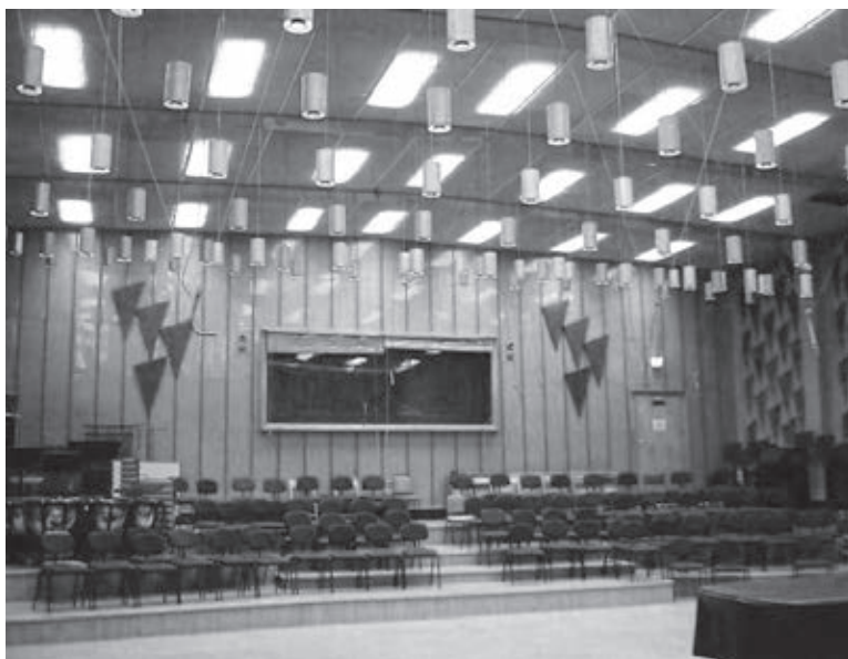
A 6-os belső tere az új burkolatával, háttérben a sztereó technikai helyiség áttekintőablakával

A sztereó felvételek a mono technikával ellentétben sokkal intenzívebben vonják be a természetes hangteret, hiszen egyik értelme éppen az, hogy a hallgatót ne csupán irány-, hanem térélményben is része-