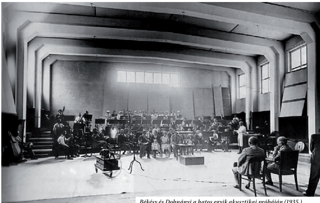
Békésy és Dohnányi a hatos egyik akusztikai próbáján (1935.)

A Bródy Sándor utcai rádióház egyik büszkesége a VI-os stúdió, amelyet joggal csodálnak meg külföldi rádiós