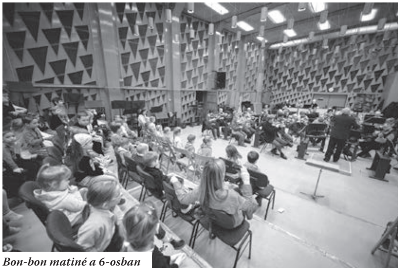
Bon-bon matiné a 6-osban

terme Budapestnek, ám gondoljuk csak el, hogy mi történne akkor, ha mondjuk a Bartók adófőszerkesztőség elhatározná, hogy a Művészetek Palotájának hangversenytermét kibérli egy hétre, hogy ott egy teljes stúdióoperafelvételt – tehát nem koncertszerűen – rögzítsen, ami pedig indokolt lenne, hiszen érdemes megszámlálni, hogy a Rádió évtizedekkel ezelőtt a magyar művészekkel hány teljes operát és operettet rögzített, és hányat rögzíthet ma! Mert egy hangversenyterem elsődlegesen a koncertek céljait szolgálja, esetenként hangfelvételi lehetőséget is kínálva, míg a hangversenystúdió kialakítását tekintve alapvetően a felvételek céljait veszi figyelembe, olykor – viszonylag korlátozott számú – hallgatóságot is feltételezve. Másrészt egy rádió miért fizessen – a pénz mindenhatósága által egyébként is felkorbácsolt – terembérleti díjakat, ha (normális esetben) van saját nagyzenekari stúdiója, amelyben ráadásul nem kell a zenei rendezőnek emeleteket lifteznie, ha szót kíván váltani a művészekkel. Vagyis a hangversenyterem és a hangversenystúdió említett „összemosása” rendkívül hibás döntés volt!