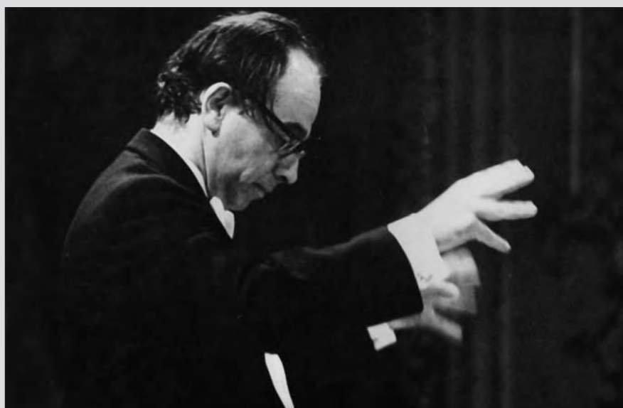
Archív kép a '80-as évekből