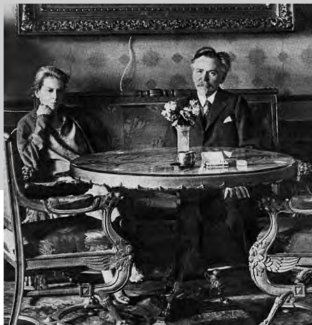
Hubay Jenő és felesége palotájuk szalonjában 1927-ben