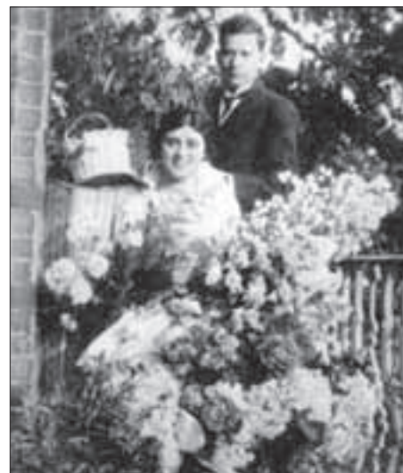
Zimbalist és Alma Gluck esküvői képe (1914. június 15., London, Cornwall Terrace 10.)