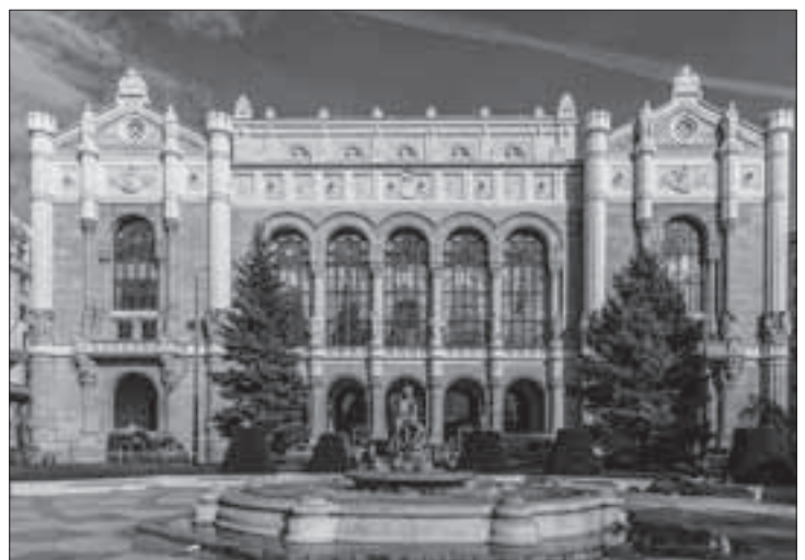
A 150 éves Pesti Vigadó