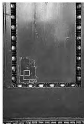
Restaurátorok által feltárt eredeti felület és díszítés a Nagyterem fa falburkolatán, amelyet a felújítás során visszaállítanak

■ A Zeneakadémia sajnós elbírásúlt a nagy értékű hangszerlopásokról. Mit szándékoznak tenni a nagyobb biztonság érdekében?