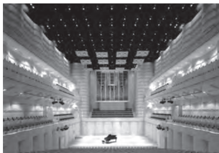
Két „cipősdoboz”: a lipcei Alte Gewandhaus és a dortmundi Konzerthaus

Hamburgban 1908. június 4-én avatták fel ünnepélyes körülmények között a Laeiszhalle-t. Eredetileg Németország legnagyobb és legmodernebb hangversenyterme volt, amely azóta zenetörténetet írt: Richard Strauss, Sergej Prokofjev és Igor Sztravinszky lépett fel; a zongorista Vladimir Horowitz élte meg itt nagy debütálását, és a tizenkét éves hegedűs Yehudi Menuhin váltott ki a közönségből valóságos lelkesedési hullámot. A második világháború után, amit a ház sértetlenül túlélte, a Laeiszhalle egy szokatlan intermezzót élt át: a brit megszállók a helyiségeket átmenetileg a BFN katonai adó épületeként használták.