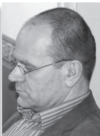
Gyüdi Sándor Szegedi Szimfonikus Zenekar