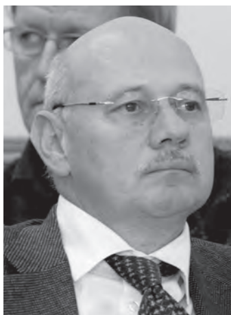
Ignác Ervin Szobnoki Szimfonikus Zenekar

– Az előadó-művészeti törvény alapján is van lehetőség arra, hogy kiemelt módon támogatassanak olyan együtteseket, amelyek az átlagostól eltérően szerveződnek. Jó példa erre a Budapesti Fesztiválzenekar, amely nem intézményként működik, nem is önkormányzat által fenntartott, hanem egy magánalapítvány, s a fővárosi önkormányzat támogatási szerződése és a miniszterrel kötött, közszolgáltatási támogatási szerződés alapozza meg költségvetését, működési feltételeit. Ha támogatni akar a kormány, arra számos egyéb lehetősége van: pályázati utak, közszolgáltatási szerződéssel, feltételrendszer teljesítése alapján. Mindig a miniszter szakmai felelőssége, pénzügyi lehetősége, hogy vállalkozik-e erre. Van egy másik sávja ennek, ami nem az előadó-művészeti törvény kérdése, hanem magyar munkajogi kérdés. Kérdés, meddig vállalkozás, megbízás egy jogviszony és mikor válik ösztönözte a vállalkozásokat, amelyek ezen a területen főképp kényszervállalkozások.