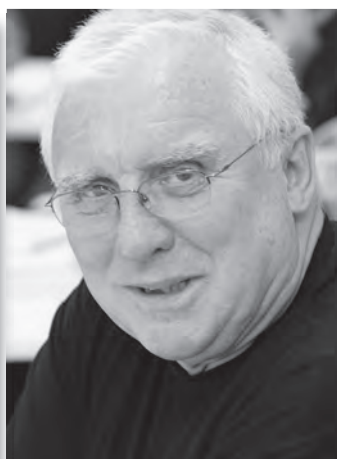
Baross Gábor Szegedi Szimfonikus Zenekar