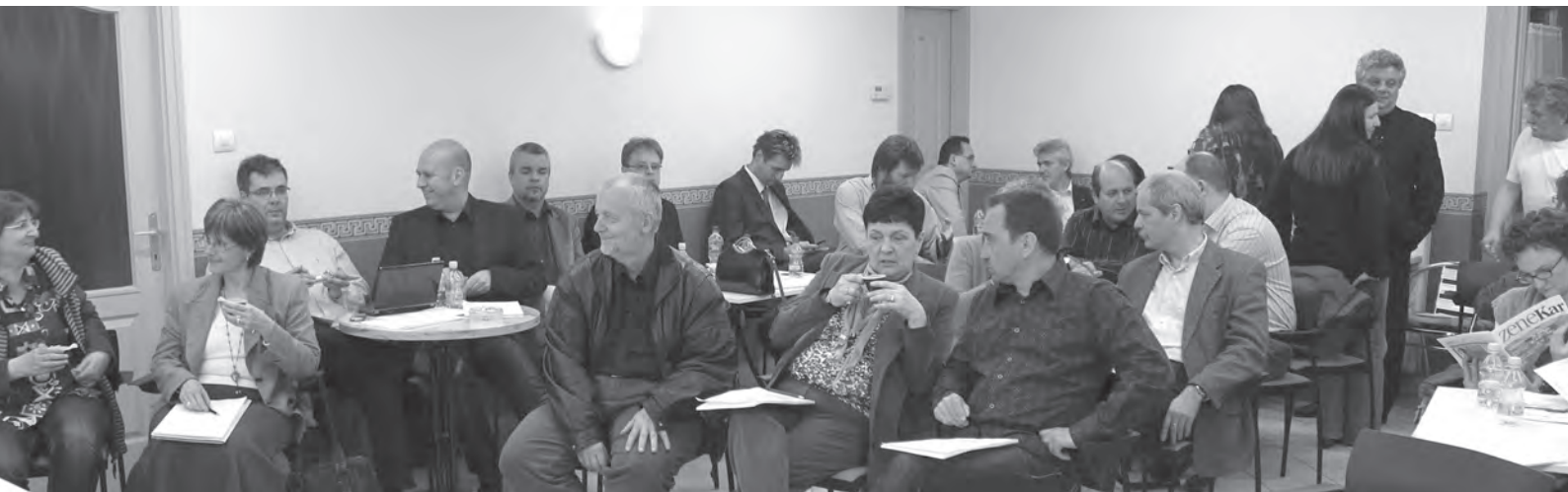
Munkáltatók és munkavállalók cserélik ki gondolataikat az Előadó-művészeti Törvényről