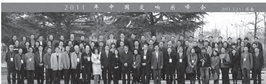
A konferencia csoportképe