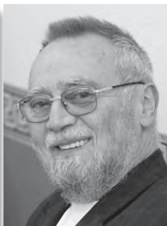
Victor Máté Magyar Zenei Tanács