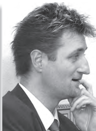
Mérei Tamás Savaria Szimfonikus Zenekar