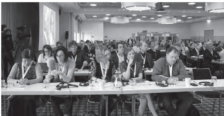
Pillanatkép a konferenciáról

– Így igaz, s a munkaszerződésekkel kapcsolatban több, mint különös volt arról hallanom, hogy ahol nem közalkalmazotti vagy hosszú távú szerződéssel foglalkoztatják a zenészt, ott is az úgynevezett önfoglalkoztató forma dívik. Ilyen a négy nagy londoni zenekar, amelyek kft-ként működnek. A tulajdonosok maguk a zenekari tagok, s ők gondoskodnak a járulékok befizetéséről. Az a forma, amelyet nálunk a törvény is tilt, hogy valaki vállalkozóként nyújtana szolgáltatást egy zenekarnak, jószerivel ismeretlen.