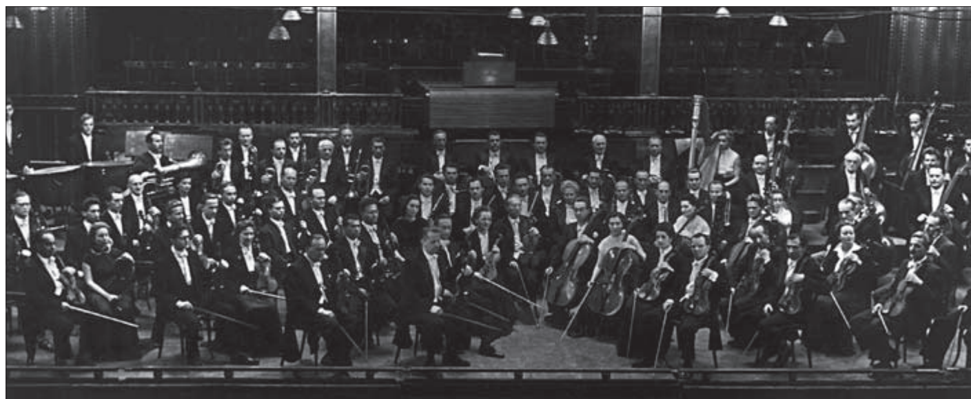
Az ÁHZ a Zeneakadémia Nagytermében

■ A Székesfővárosi Zenekar kezdetben te- bát nem hivatásos muzsikusból állt.