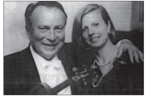
Henryk Szeryng és felesége

„Aki egyszer már részt vett a mesterkurzusomon, azt már a növendékeim között tartom számon. Évente kétszer tartok tíz növendék részére két hetes kurzust a Mexikói Egyetemen. Ilyenkor a terem zsúfolásig megtelik hallgatókkal. Genfben is nagyjából ennyi növendék vesz részt az egy hónapos kurzuson, és itt is megjelenik 70-80 hallgató. Három órán keresztül tart a tanítás, szünet nélkül. Úgy gondolom, a szünet megzavarja a koncentrációt. Amikor 3-4 napos mesterkurzust tartok, a honoráriumot mindig valamelyik alapítványnak ajánlom fel, hogy fordítsák olyan kiemelkedő, fiatal hegedűs támogatására, akinek erre szüksége van. Azokat a briliáns, koncertező hegedűsöket, akik hűek maradtak a hegedűjátékról vallott elveimhez – és szinte minden kontinensen akadnak ilyenek – „lelki gyermekeim”-nek hívom. Számomra fontos, hogy tudjam, a növendéknek adott tanács hasznos volt, és sikerre vezetett – hogy közöttünk emberi, lelki és zenei kapcsolat van. De ha mégsem hoz gyümölcsöt próbálkozásom, amikor érzéseimet és elképzeléseimet próbálom átplántálni egy növendékbe, akkor nem erőltetem, hogy az én elképzelésemet fogadja el. A legfontosabb hogy megértse, mindig a zene áll az első helyen. Lehet, hogy az ujjrendem,