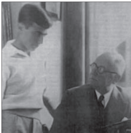
A fiatal Szeryng és Flesch Károly