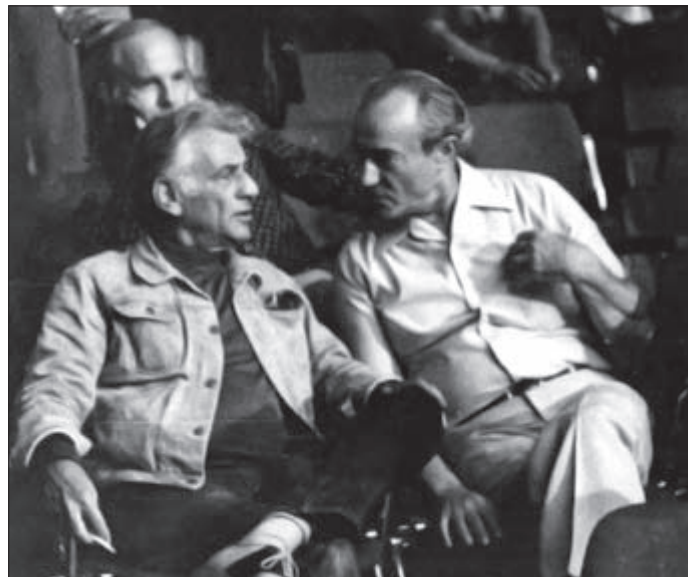
Leonard Bernstein és Ferencsik János

toár is a nagyobb létszámú szimfonikus művek irányába bővült. Ugyanakkor az is igaz, hogy akkor nem voltak duplázó fúvósok, és mindenki végigjátszott egy teljes koncertet, tehát a fúvósok nem váltották egymást. De fiatalon ez nem tűnt olyan megterhelőnek, mint most így visszatekintve. Nagy motivációt jelentett az is, hogy az ember egy ilyen komoly presztízssű zenekarban játszhatott.