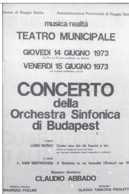
Claudio Abbado a 6-os stúdióban próbál a Rádiózenekarral az 1973-as olasz turnéra