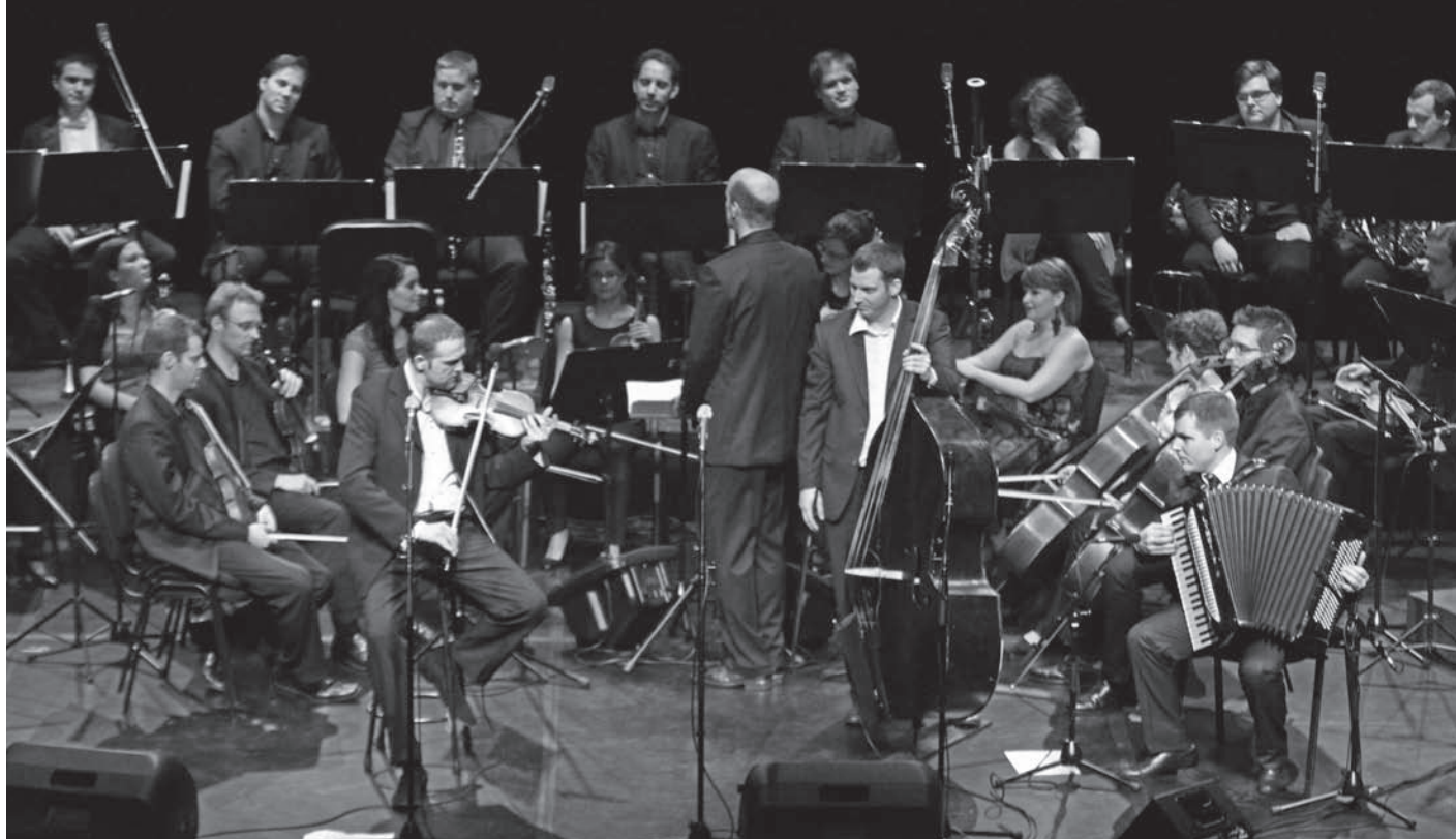
A BDZ és a Harmonia Garden crossover bangversenye a MOM kulturális központban