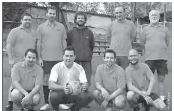
A Pannon Filharmonikusok – Pécs csapata