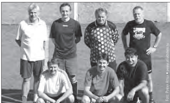
A MÁV Szimfonikusok csapata