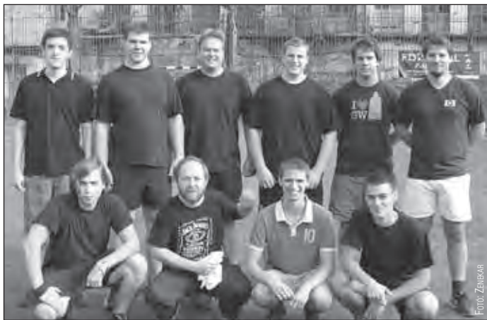
A Zuglói Filharmonia – Szent István Király Szimfonikus Zenekar csapata