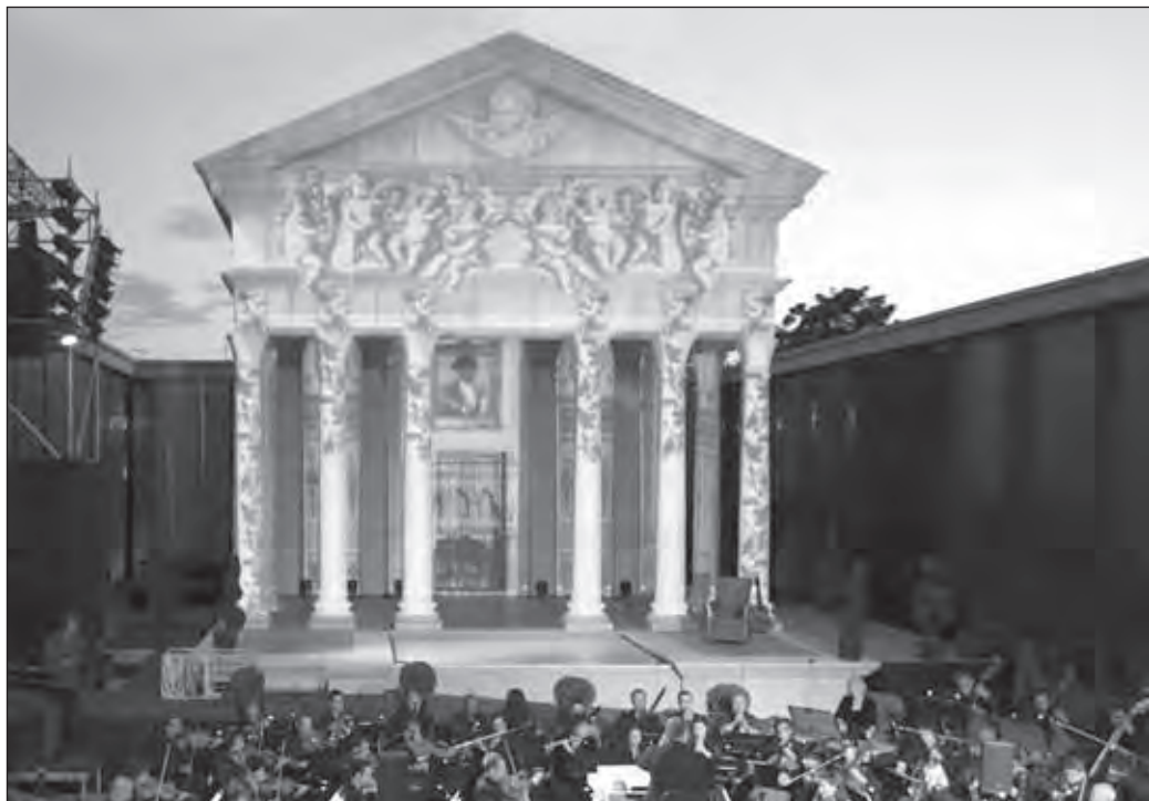
A Savaria Szimfonikusok az Iseumi szabadtéri játékokon

A Pannon Filharmonikusok a június 21-én megtartott Mesterek és tanítványaik hangversenyével kedveskedett a nyári programok iránt érdeklődőknek. A koncerten hat fiatal tizenéves tehetség mutatkozott be