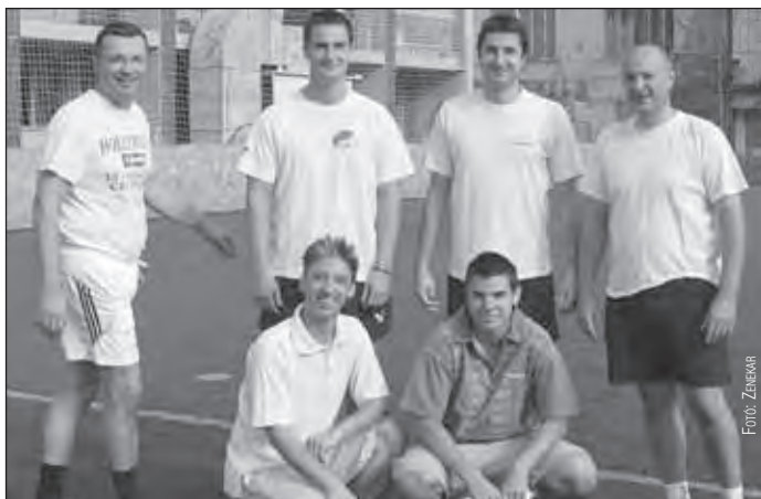
Az első helyen végzett Rádiózenekar induló csapata