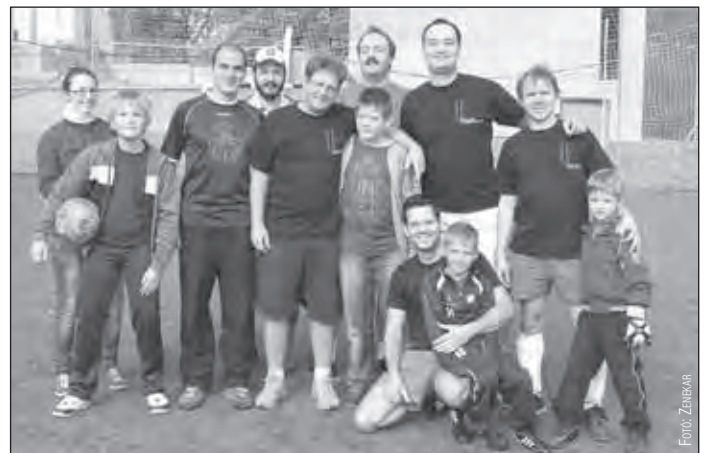
A Liszt Ferenc Kamarazenekar csapata