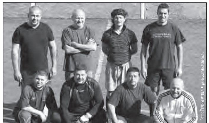
A Nemzeti Filharmonikusok csapata