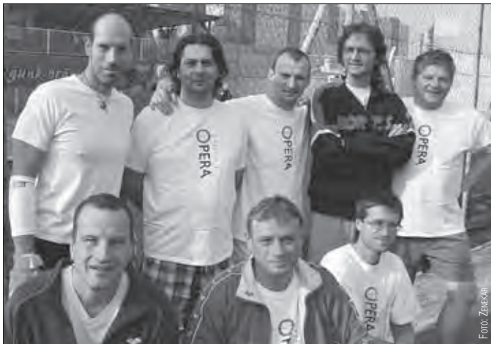
A Magyar Állami Operabázis csapata