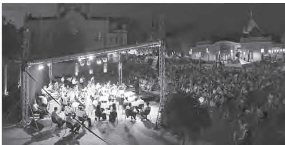
A Szolnoki Szimfonikus Zenekar a Tisza-parti szabadtéri előadáson

A nyár közepén, július 16-án a Zuglói Filharmónia – Szent István Szimfonikus Zenekar exkluzív környezetben, a Vajdahunyad