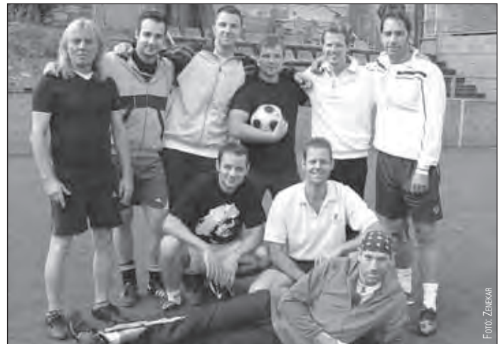
A Budafoki Dobnányi Ernő Szimfonikus Zenekar csapata