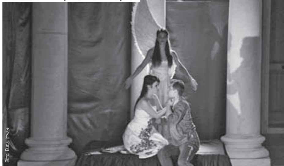
Iseumi Szabadtéri Játékok – Rómeó és Júlia