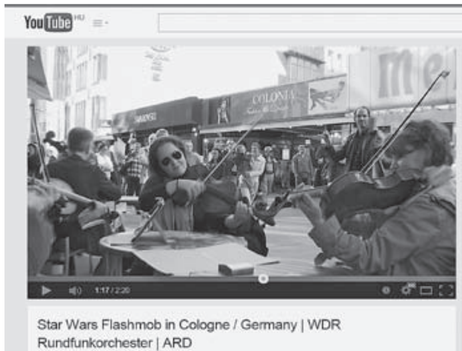
Star Wars Flashmob in Cologne / Germany | WDR Rundfunkorchester | ARD

Több mint két millióan látogatták a Kölni Rádiózenekar (WDR Rundfunkorchester Köln) falsbmobját: http://www.youtube.com/watch?v=sTHXlZHPyqE