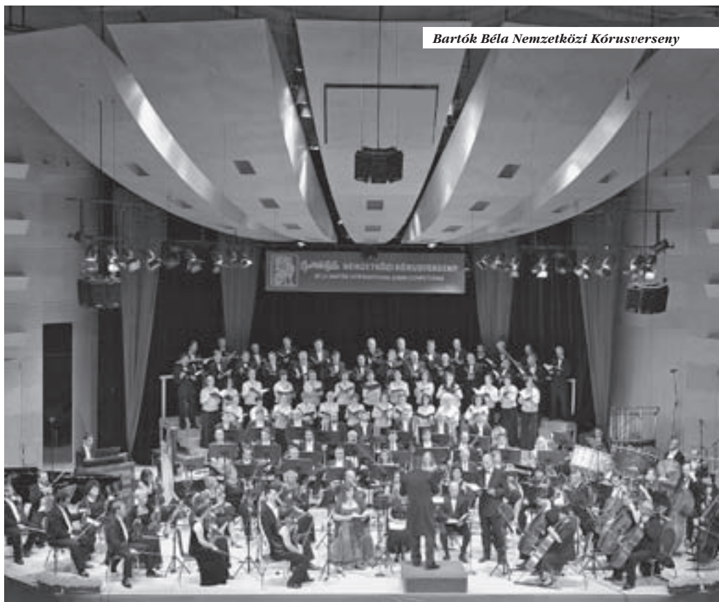
Bartók Béla Nemzetközi Kórusverseny