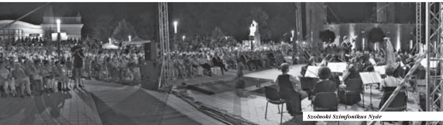
Szolnoki Szimfonikus Nyár

neves nemzetközi fesztiválon első alkalommal játszhattak. Majd a hónap végén itthon vendégszerepeltek, június 27-én, Szekszárdon Vivaldi Négy évszak című művének lemezbemutató hangversenyére került sor. A régió városai közül Szekszárdon szinte minden évben játszik a zenekar, így most a Pécsi Szimfonia 2013 év folyamán elkészült lemezének bemutatására is sor kerülhetett.