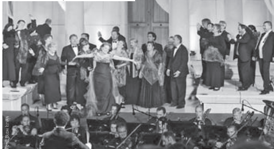
Iseumi Szabadtéri Játékok – Verdi Traviata