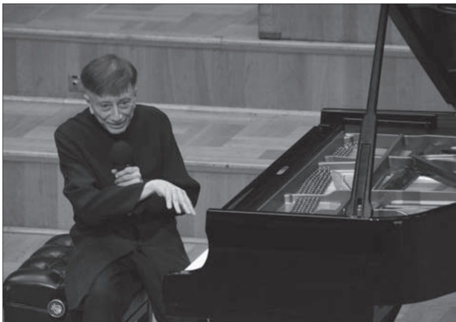
Koncerttel ünnepelte Vásáry Tamás zongoraművész, karmester 80. születésnapját Debrecenben. Az Ifjú zeneművészek Nyári Akadémiájának kísérőrendezvényén ballhatta a közönség az izgalmas, virtuóz hangversenyt

dán együttessel, amelynek tagjai megszokták, hogy mindenki gazsulál nekik, így az első próbán elmondottakra csak rángatták a vállukat. Másnap semmit sem csináltak meg abból, amit kértem. Ekkor mondtam azt: egy zenekarnak vagy memóriája, vagy ceruzája legyen... Végtelen türelmem van ahhoz, hogy egy rosszul játszó együttesből kihozzam a legtöbbet, de ha valakik nemtörődömségből muzsikálnak rosszul, az halálosan fel tud bosszantani.