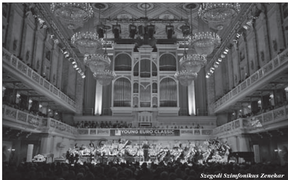
Szegedi Szimfonikus Zenekar

Másnap pedig – a Steglitz-Zehlendorf és Zugló között meglévő kiváló testvérvárosi kapcsolatnak köszönhetően – a Liebermann