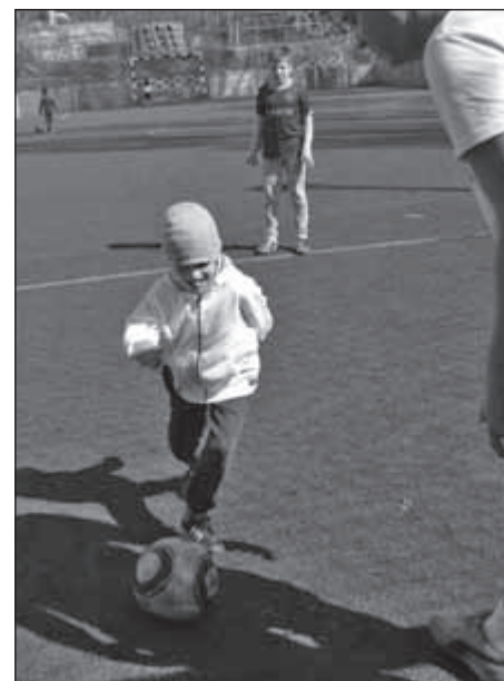
Edzésben az utánpótlás