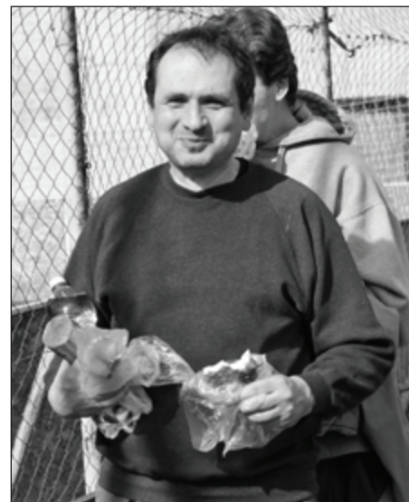
A második belyezett „kórus-csapat” csatára nagy súlyt fektet az energiapótlásra