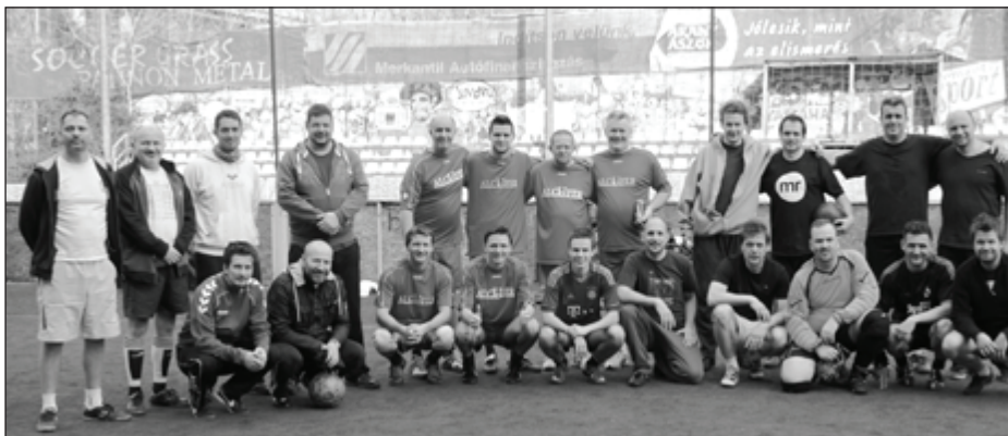
A három dobogós csapat (Balról jobbra: NFZ, GYFZ, Kórus)

Pannon Filharmonikusok – Pécs Rádiózenekar Szolnoki Szimfonikus Zenekar Zuglói Filharmónia