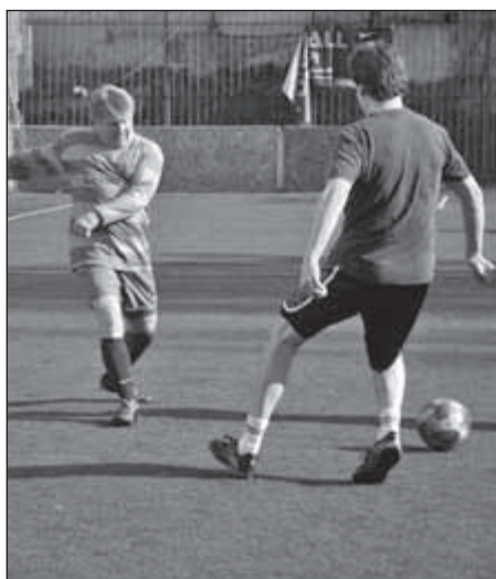
Munkában a tavalyi futballkupa győztes csapatának csatára