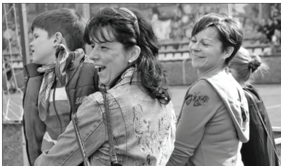
A családtagok is bozzájárultak biztatásukkal a Nemzeti Filharmonikusok 3. belyezéséhez