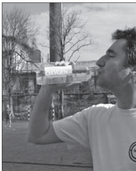
Ez itt a reklám helye: A Sales One Kft. által forgalmazott Gilroy Oxygen vizekkel oltbatták szomjukat a rangadó résztvevői

Dohnányi Ernő Szimfonikus Zenekar Győri Filharmonikus Zenekar Kodály Filharmónia – Debrecen Kolozsvári Magyar Opera Kórusok (Honvéd-, Nemzeti -, Rádió-kórus) Magyar Állami Operaház MÁV Szimfonikus Zenekar Nemzeti Filharmonikusok