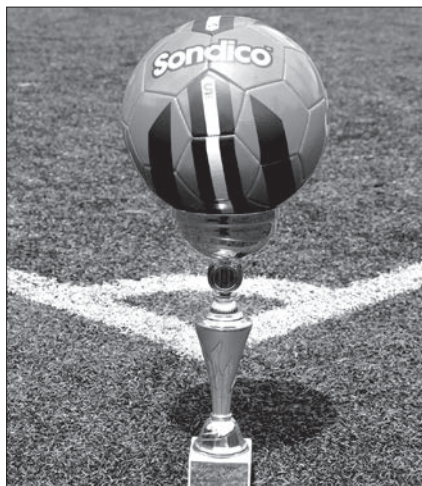
A győztes csapatnak járó serleg és focilabda

Concerto Budapest, Győri Filharmonikusok, MÁV Szimfonikus Zenekar, Nemzeti Filharmonikus Zenekar és Kórus, Opera, Rádiózenekar, Szolnoki Szimfonikusok, Zuglói Filharmonia.