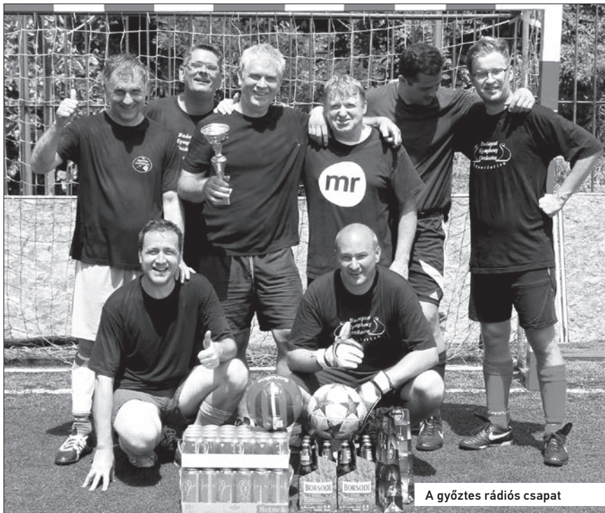
A győztes rádiós csapat

A Magyar Szimfonikus Zenekarok Szövetsége által biztosított, a győztesnek kijáró serleget idén a Rádiózenekar csapata nyerte el.