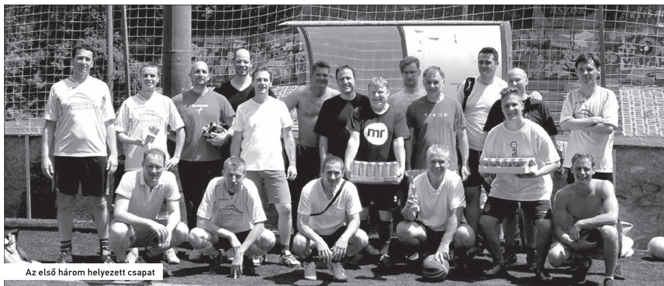
Az első három helyezett csapat