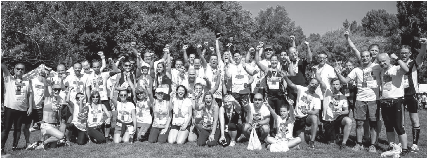
PVK csoportkép az induló csapatokról

„Nem az idő, hanem a megtett út a fontos”