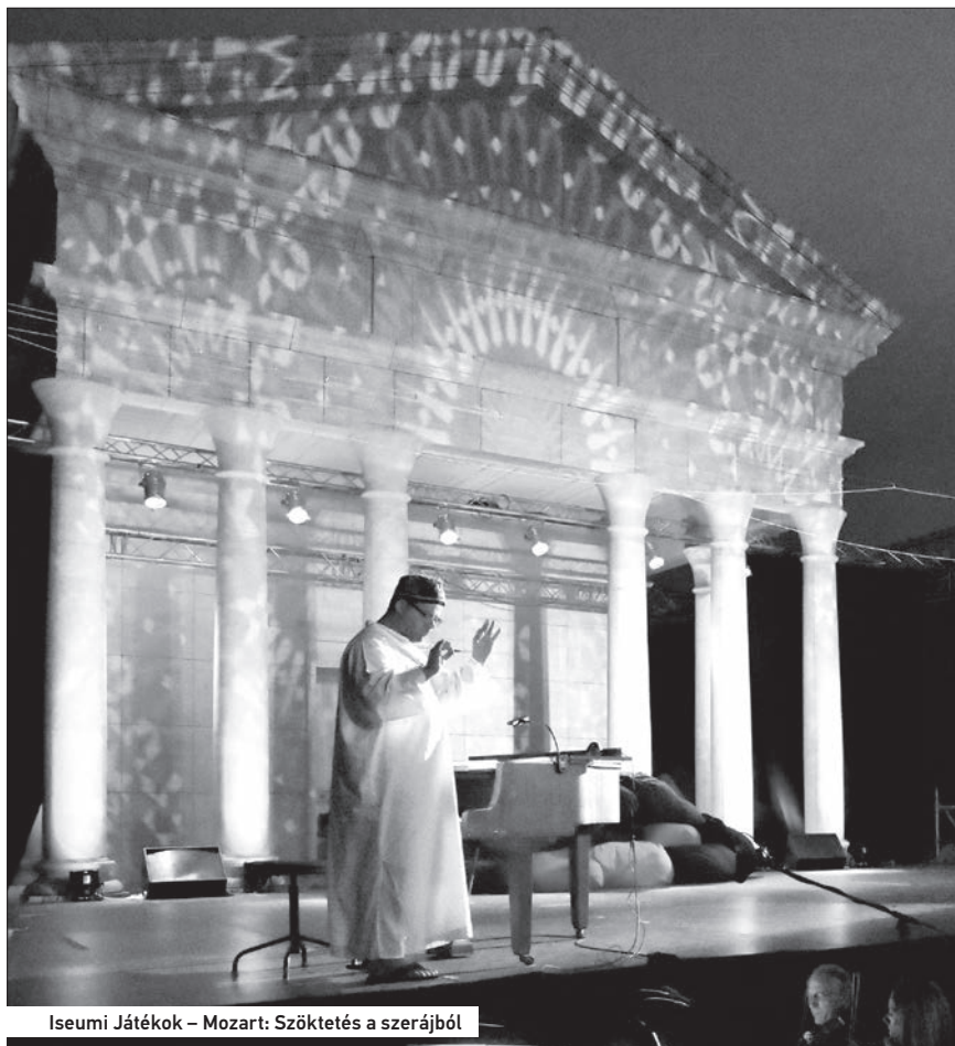
Iseumi Játékok – Mozart: Szöktetés a szerájból