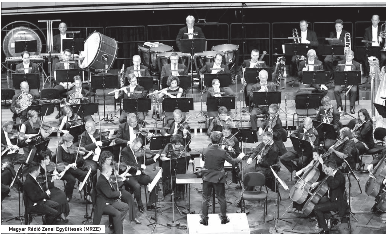
Magyar Rádió Zenei Együttesek (MRZE)

Az ország egyik legnagyobb kulturális eseménye a Debreceni Virágkarnevál. Több tízezer turista érkezik ilyenkor a városba. Az egy héten át tartó rendezvénysorozaton minden évben, immár hagyományszerűen jelen vagyunk mi is egy-egy rendhagyó koncerttel. Idén Ünnepi nyitány című műsorunkkal vártuk a teltházas közönséget